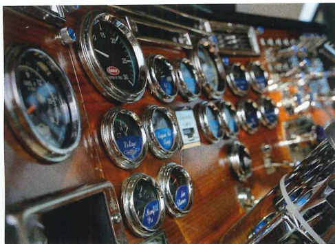
Kromringar till mätare och brytare kan man lätt få tag på i amerikanska affärer.