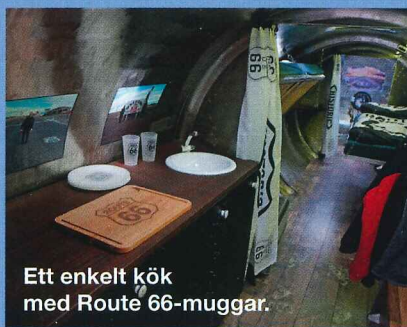
Ett enkelt kök med Route 66-muggar.

Att bygga om tanktrailer till en husvagn var mycket kreativt. Hela interiören andas Route 66 och USA.